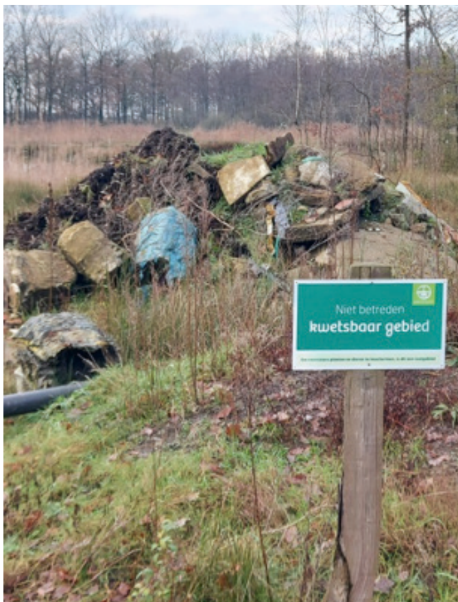
Hoezo kwetsbaar gebied?